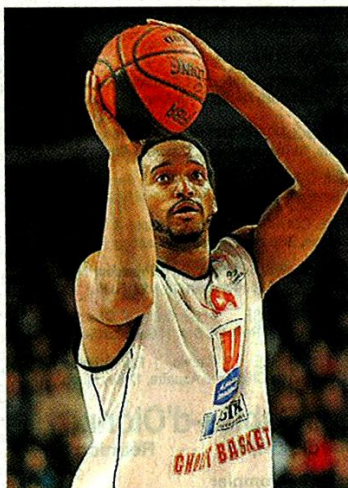
Archives Georges Mesnager

Les Choletais sont rentrés hier matin d'Allemagne. Aucun entraînement