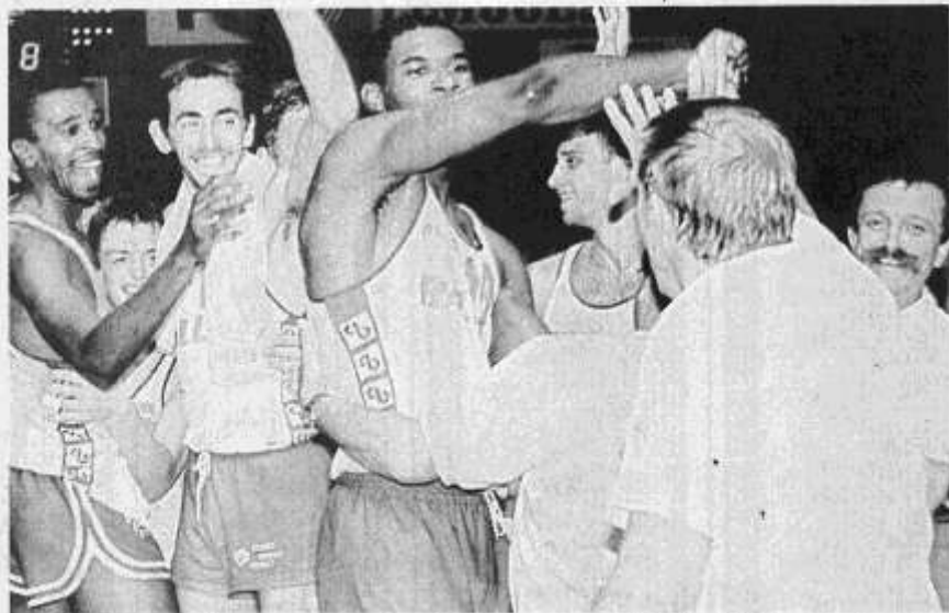
Cholet-Basket avait commencé la saison 87-88 sur un grand éclat de rire à Limoges. Ce soir, les Choletais aimeraient bien inaugurer l'année 1988 de la même manière

Arbitres : MM. Mailhabiau et Gasperin. Délégué fédéral : M. Max Mamie. Lever de rideau, à 18 h 15 : espoirs CB - espoirs Racing.