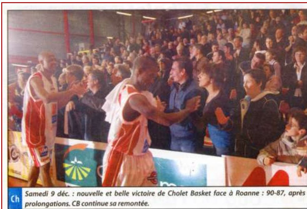
Ch Samedi 9 déc. : nouvelle et belle victoire de Cholet Basket face à Roanne : 90-87, après prolongations. CB continue sa remontée.

ROANNE : Harper 22, Cazalon 8, Spencer 19, Badiane 13, Salyers 25.