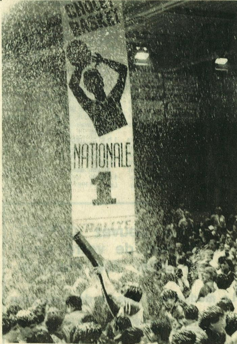
CHOLET-BASKET-SAINT-BRIEUC. — Show-le-basket : A l'issue de la rencontre, les spectateurs eurent droit à un show à l'américaine, avec projecteurs, banderoles et des dizaines de kilos de confetti.