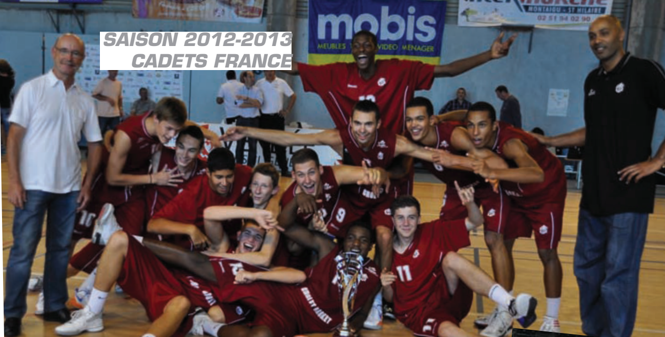
Vainqueur du Tournoi National de Montaigu