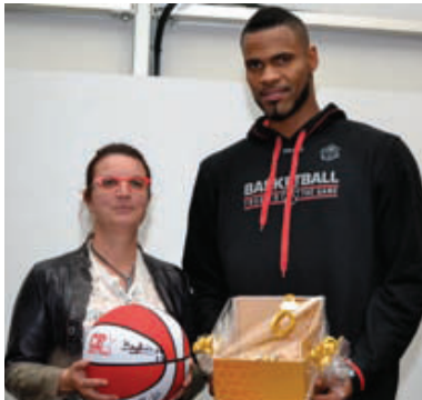
Concours de Pronostics FAMILLE MARY - CHOLET BASKET