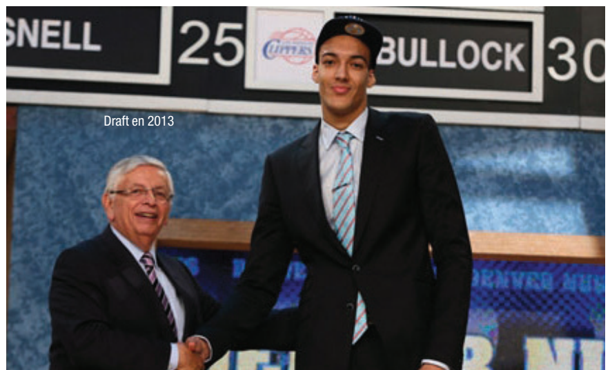
Draft en 2013

J'ai été officiellement drafté par Denver, mais officieusement, c'est Utah qui m'a choisi et qui a passé un deal avec Denver pour ensuite m'échanger. En ce qui concerne la position, j'étais content d'être passé au 1er tour et de rejoindre les Jazz, mais