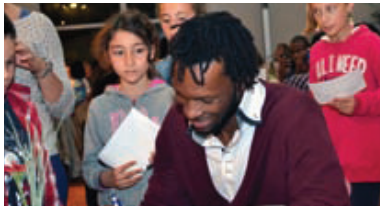
Rencontre avec les joueurs