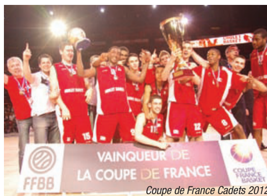
Coupe de France Cadets 2012

Champion de France Espoirs 87/88 - 88/89 - 96/97 - 08/09 - 09/10 Vainqueur du Trophée du Futur 88/89 - 99/00 - 00/01 Champion de France Cadets 92/93 - 93/94 - 94/95 - 96/97 - 97/98 - 99/00 - 00/01 Champion de France Cadets Groupe B de la 1 ère division 07-08 Coupe de France Cadets 86/87 - 89/90 - 96/97 - 00/01 - 11/12 Tournoi International Cadets de la Jeune France 2003 et 2006