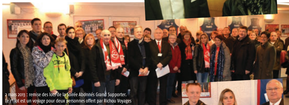
2 mars 2013 : remise des lots de la Soirée Abonnés Grand Supporter. Le 1 er lot est un voyage pour deux personnes offert par Richou Voyages