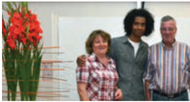
Remise de la composition florale réalisée par MONCEAU FLEURS