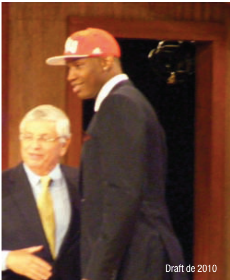
Draft de 2010