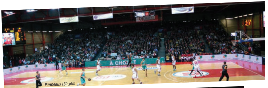
Panneaux LED 36m