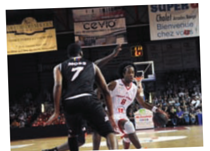
Bâches et Protections de pieds de paniers

Grâce aux différents supports de communication que nous vous proposons dans la salle de la Meilleraie, vous avez l'opportunité d'augmenter votre notoriété et d'associer votre image aux valeurs de Cholet Basket auprès de notre public et des téléspectateurs lorsque les matches sont télévisés.