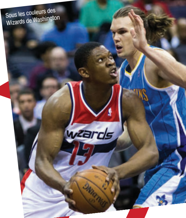
Sous les couleurs des Wizards de Washington

Gardes la tête froide. Continues à travailler comme tu sais le faire. Tu as les qualités pour réussir et une envergure de monstre. Bosses et tu réussiras. Je suis fier de toi !