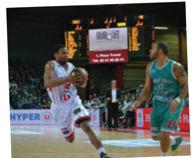
Ecrans géants (technologie SMD)