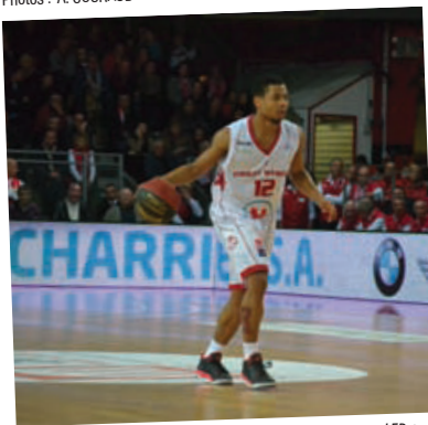
Panneaux LED 24m