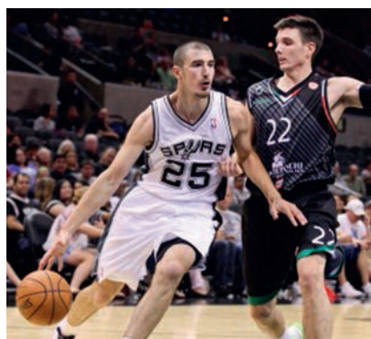
Nando De Colo - San Antonio Spurs