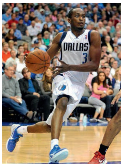
Rodrigue Beaubois - Dallas Mavericks