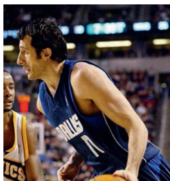
Antoine Rigaudeau - Dallas Mavericks

5 joueurs issus du Centre ont réussi à intégrer la prestigieuse NBA :