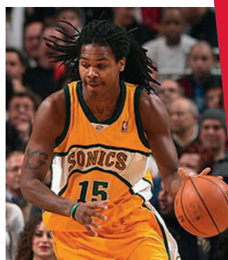
Mickael Gelabale - Seattle SuperSonics