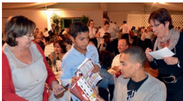
Rencontre avec les joueurs