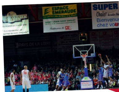
Bâches et Protections de pieds de paniers