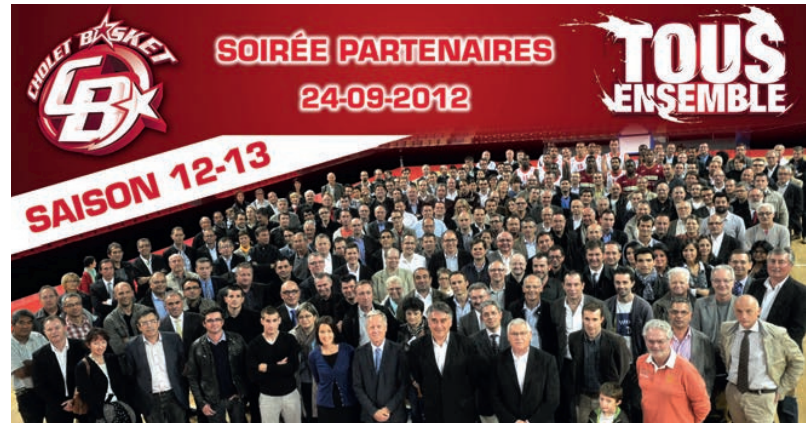
CHOLET BASKET a eu le plaisir de recevoir l'ensemble de ses Partenaires (environ 200 entreprises) lors de la soirée de pré-saison, organisée à la salle de la Meilleraie, le lundi 24 septembre 2012.