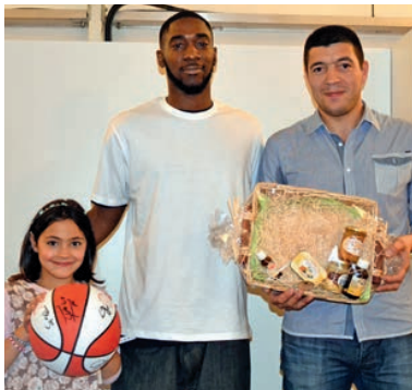
Concours de Pronostics FAMILLE MARY - CHOLET BASKET