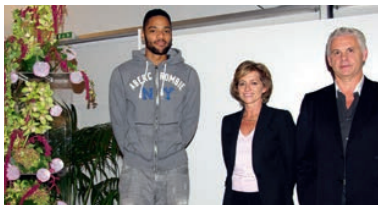
Remise de la composition florale réalisée par A L'ART FLORAL