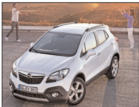
Nouvel Opel Mokka