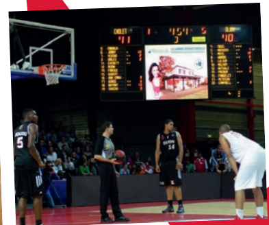
Ecrans géants (technologie SMD)