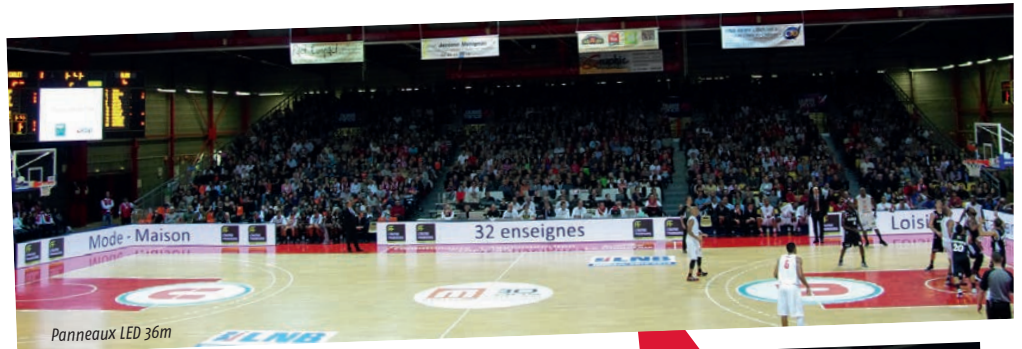
Panneaux LED 36m