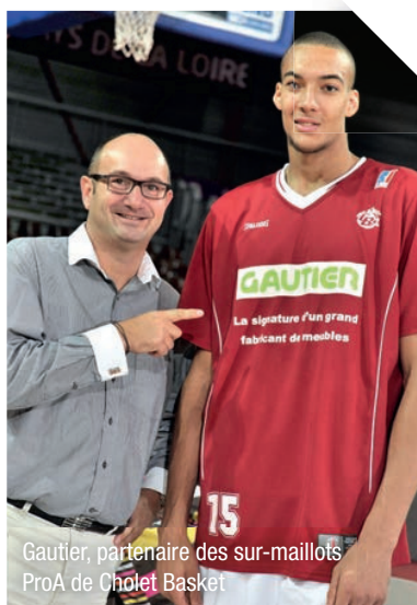
Gautier, partenaire des sur-maillots ProA de Cholet Basket