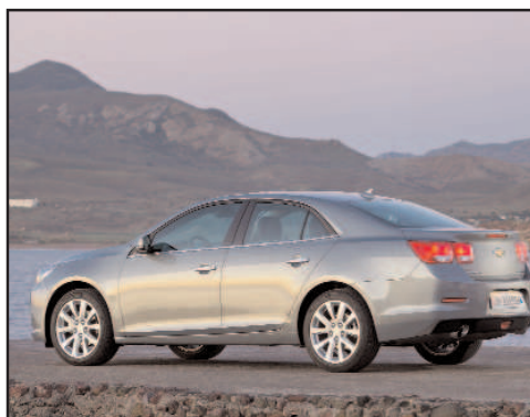
Nouvelle Chevrolet Malibu

TOURISME AUTOMOBILES - Distributeur Réparateur Agréé Opel Chevrolet 18 avenue Edmond Michelet - BP 40416 - 49304 Cholet Cedex Tél. : 02 41 65 57 15 - www.tourisme-automobiles.fr