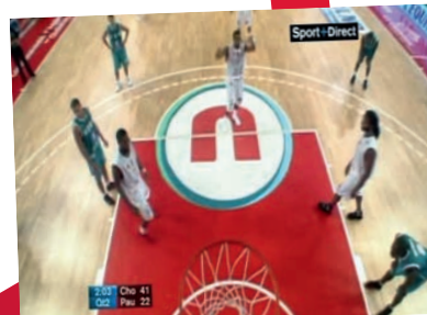
Têtes de raquettes