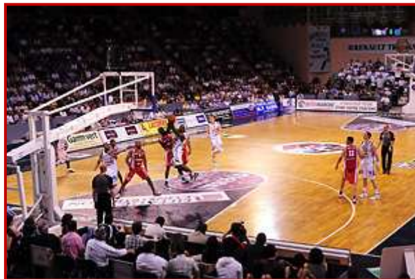
Palais des Sports de BEAUBLANC