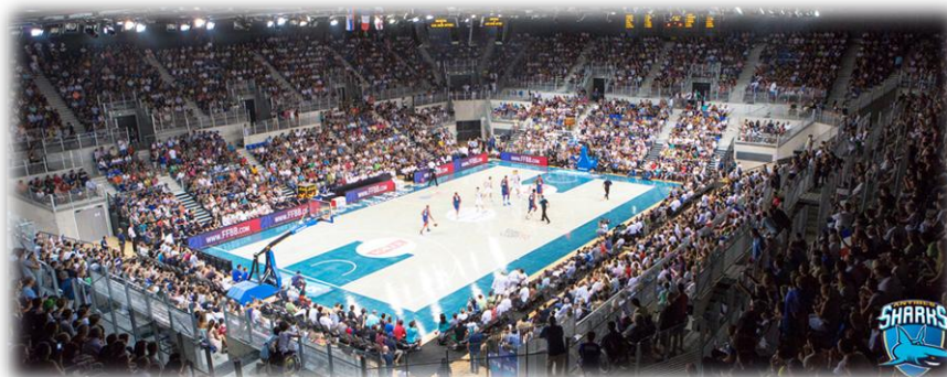
Salle Azur Arena d'Antibes