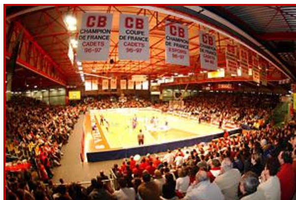
Salle de la Meilleraie