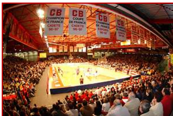
Salle de la Meilleraie