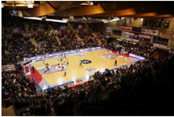
PALAIS DES SPORTS JEAN-MICHEL GEOFFROY