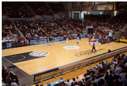
Palais des Sports de Gentilly