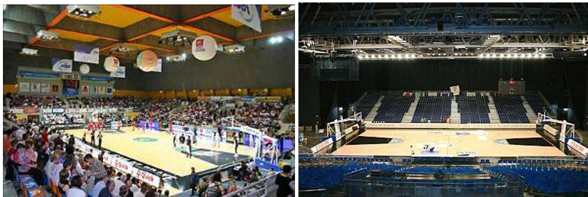
Le Palais des Sports et Le Zénith d'Orléans