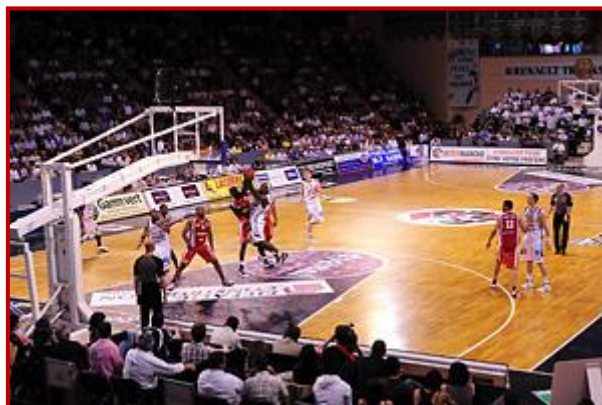
Palais des Sports de BEAUBLANC