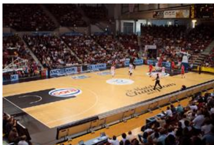
Palais des Sports de Gentilly