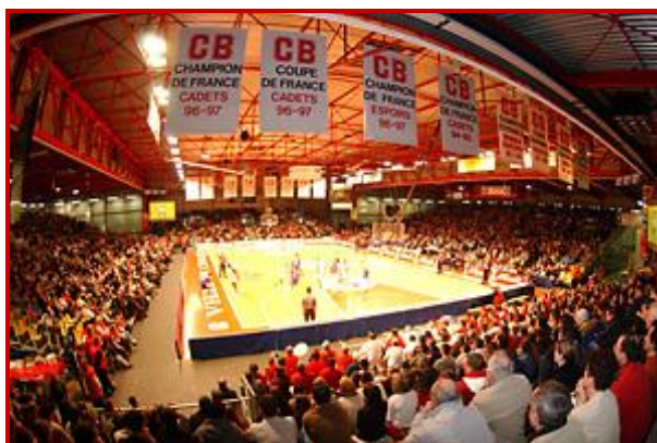
Salle de la Meilleraie