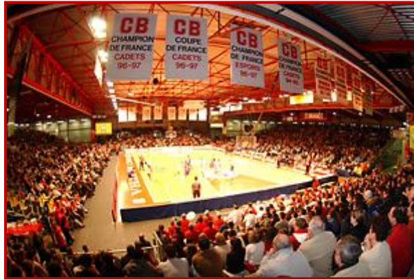
Salle de la Meilleraie