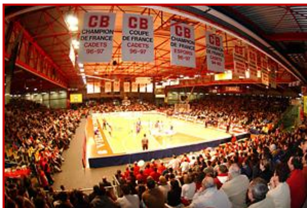
Salle de la Meilleraie