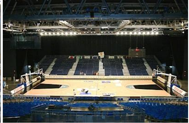
Le Palais des Sports et Le Zénith d'Orléans