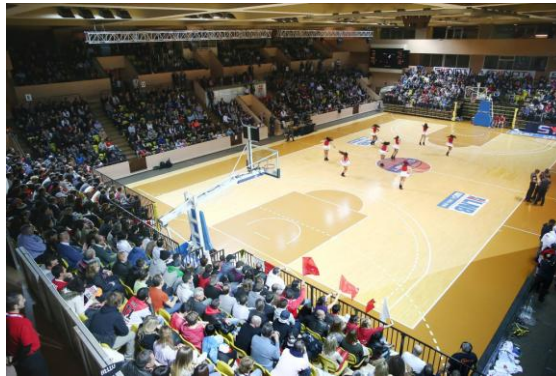
Salle Gaston Médecin