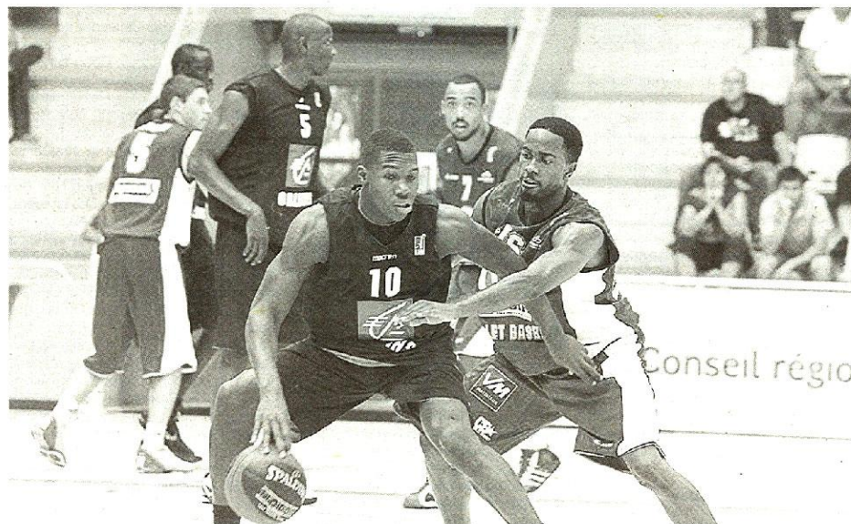
Pamba-Juille et les Orléanais ont dominé la compétition à Vannes.

Trophée du Golfe à Vannes. Orléans a régalé le public, tout en dominant Cholet (84-65). Le Mans a pris le meilleur sur Nanterre pour la 3 e place (83-81).