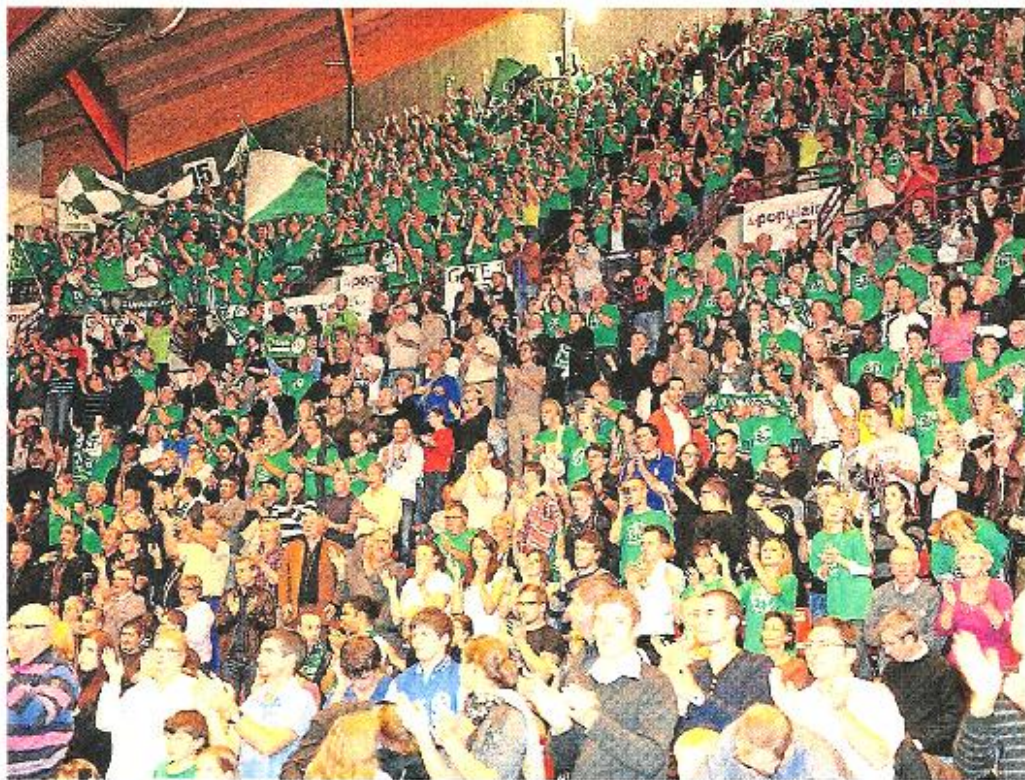
Limoges, Beaublanc, octobre 2012. Les soirs de match, la ferveur populaire agite les gradins de la salle limougeaude.