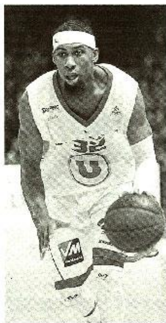
Wilson et les Choletais doivent s'imposer ce soir pour revenir à hauteur de Nantes et Orléans.

GRAVELINES : Diabate (19), Johnson (11), Akpomedah (8), Lewis (12), Rousselle (6), Diawara (6), VoGhee (2).