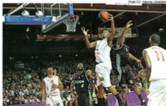
Cholet, octobre 2012. Cholet Basket pourra compter sur son public ce soir. La Meilleraie sera pleine comme un œuf.

Loto. CB organise un loto avec de nombreux lots à 20 heures samedi 10 novembre dans l'espace blanc du parc de La Meilleraie. L'ouverture des portes est prévue à 18 h 30.