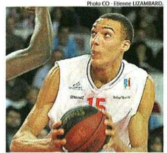
Rudy Gobert est touché à une cheville.