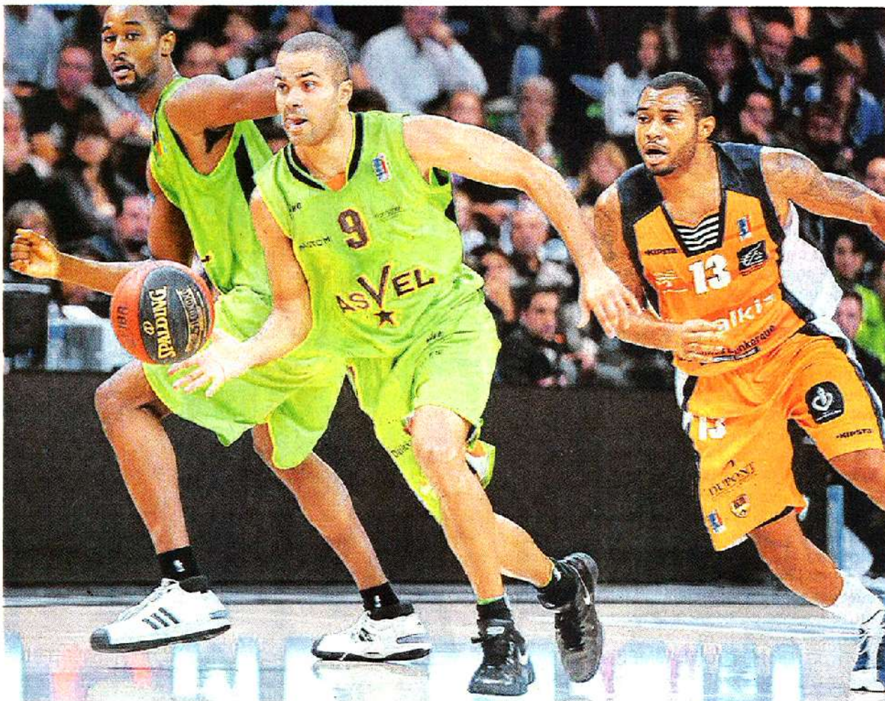
Tony Parker jouera peut-être ce soir à Cholet son dernier match en Pro A, si un accord est trouvé aux Etats-Unis pour la NBA.