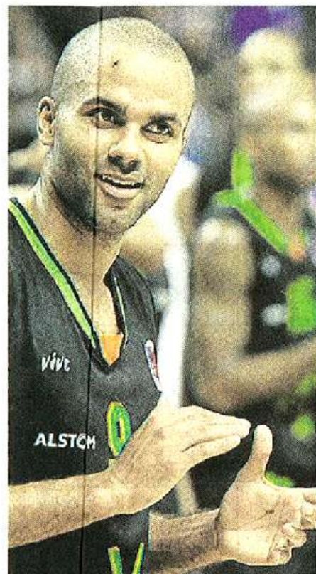
Tony Parker a connu une ascension phénoménale. Il est le plus grand joueur français de tous les temps.

5 octobre 2011. Signe avec l'Asvel pour 1 500 € par mois.