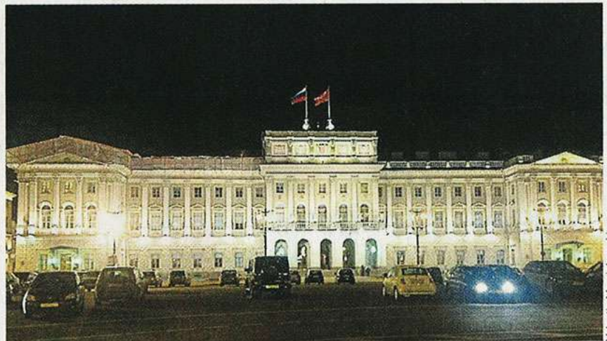
L'hôtel de ville de Saint-Petersbourg, exemple du modèle architectural.

Fondée en 1703 par le tsar Pierre Le Grand, la cité du bord de la Baltique dans laquelle se jette la Neva, a été conçue pour être « une fenêtre sur l'Europe ». Pari réussi car aujourd'hui, hormis les devantures des magasins en cyrillique, difficile de se sentir en plein milieu du monde