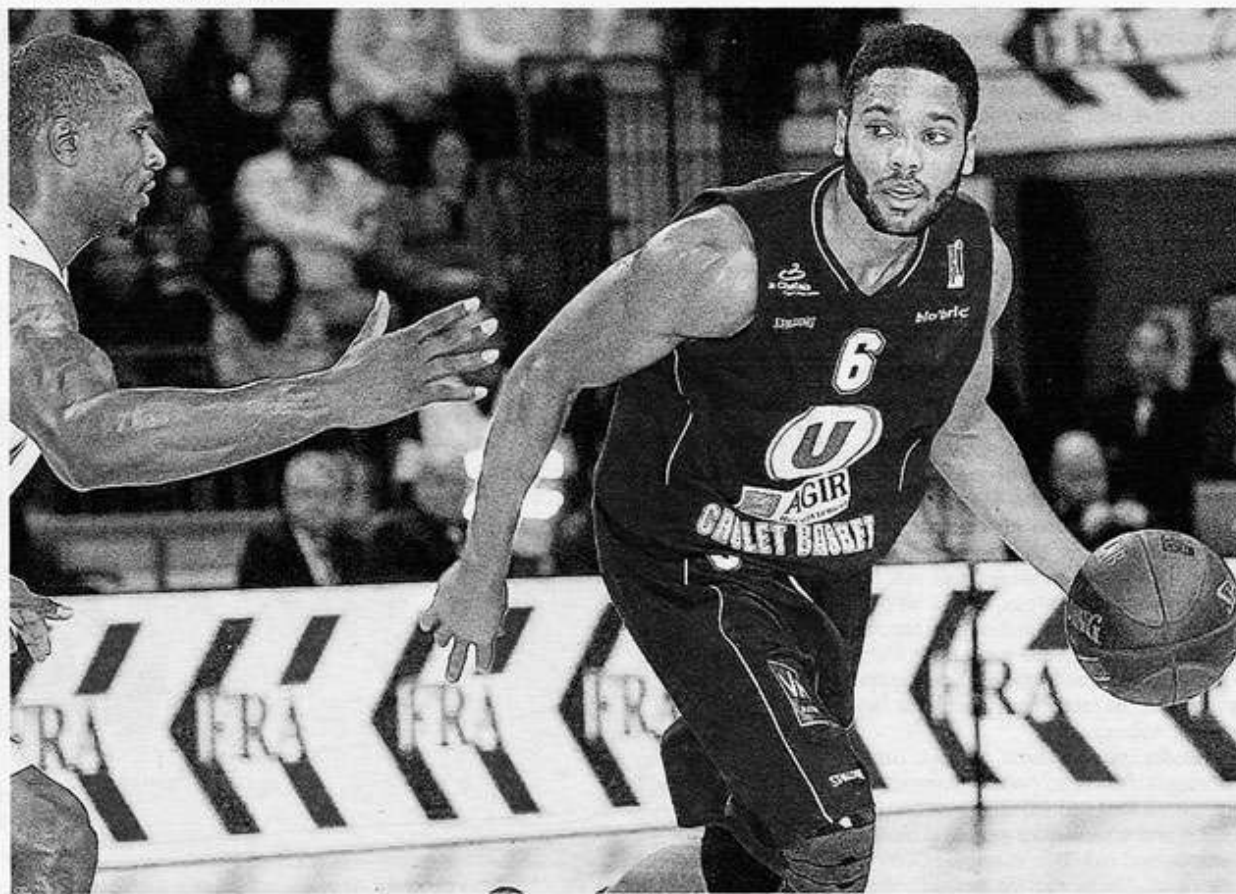
Jomy et les Choletais ont fait preuve d'une adresse insolente à trois points, hier face à Nancy.