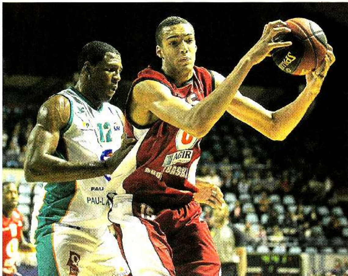
Rudy Gobert était pour la première fois de sa carrière titulaire sous les couleurs du Cholet Basket.