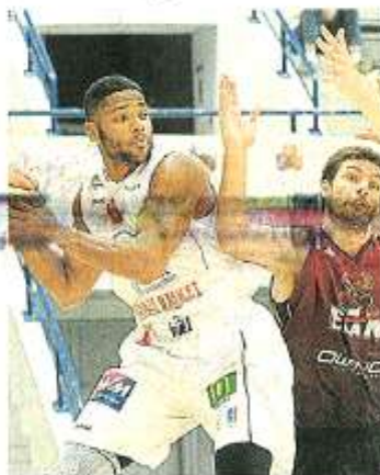
Jomby et Cholet auront-ils récupéré du match à Chalon ?

Ce soir, CB s'apprête à jouer un deuxième match en l'espace de 48 heures et va en finir avec son marathon de quatre rencontres consécutives à l'extérieur. C'est peu dire d'affirmer que le facteur fatigue risque d'être déterminant. Le coach de Cholet se dit toujours inquiet à ce sujet - notamment sur la capacité de Goree et Bryant d'accumuler des temps de jeu conséquents en l'absence de Verbobe et Gobert - mais insiste surtout sur la défense après avoir laissé les portes grandes ouvertes contre Chalon dimanche, avec 99 points encaissés (99-95, score final). « Il faut miser sur ce secteur (la défense), et non sur l'attaque. Hier (dimanche), on s'est laissés embarquer dans