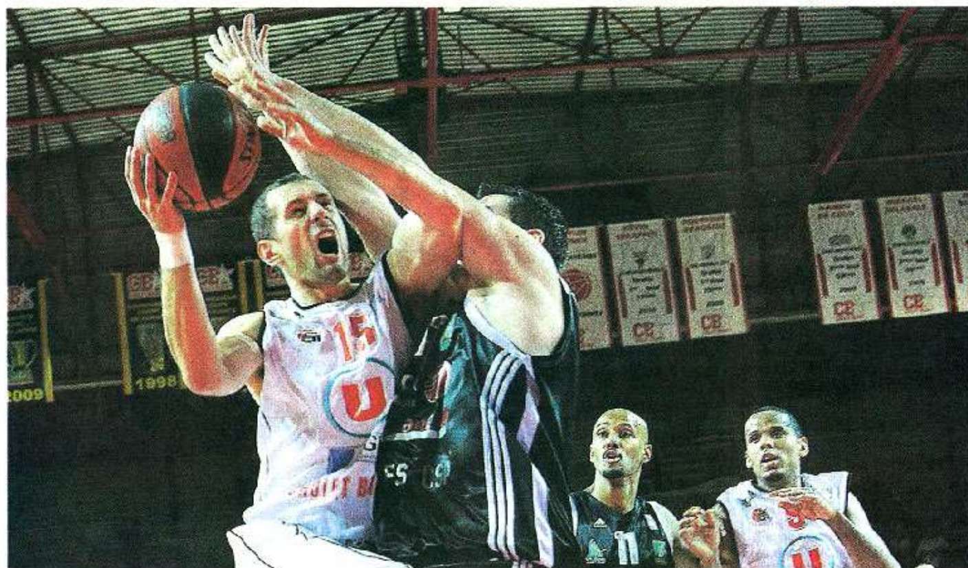
Cholet, La Meillaire, hier. Avdalovic s'arrache dans la raquette de Limoges. CB a eu besoin de lutter pour décrocher la victoire.

Les Choletais n'ont pas mis la manière mais ils ont pris le meilleur sur le CSP Limoges. Les voici en tête de Pro A à égalité avec les Roannais et Nancéiens, à qui ils rendront visite dans une semaine.