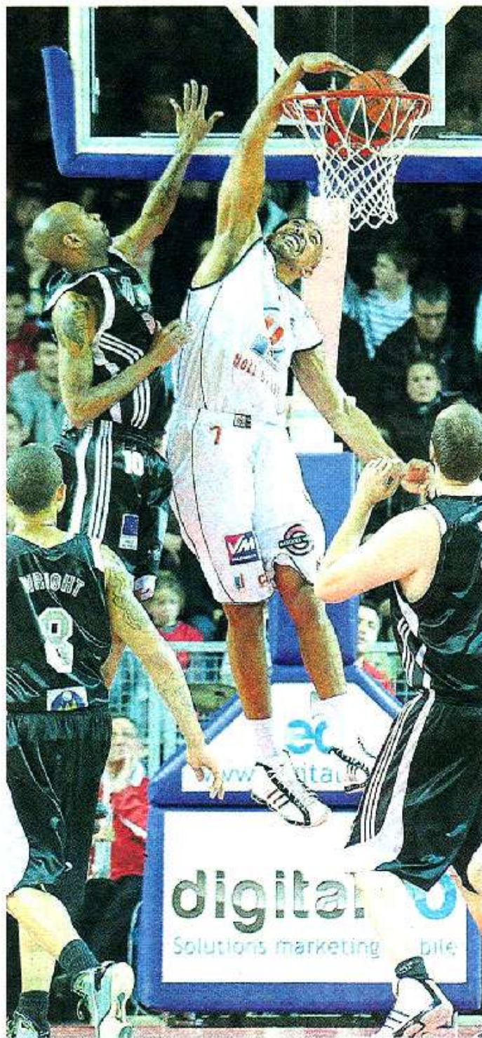
Cholet, La Meillerie, samedi. Le secteur intérieur de CB reste performant. Grâce notamment à un Vebobe bondissant.

Exit Marquis donc. Re-bonjour Duport. Scotché sur le banc depuis trois matches, le grand