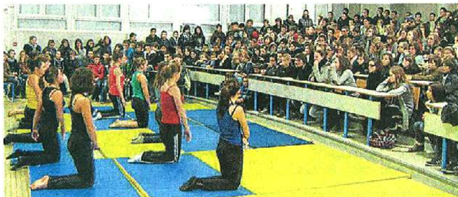
Les élèves interprètent leurs danses lors des ateliers de Noël.

A l'occasion des ateliers de Noël, une compagnie de filles composées de 5 e , 4 e et 3 e ont présenté leur chorégraphie devant l'ensemble des élèves et enseignants du collège. Cette dernière avait été interprétée lors du concours « A vos marques prêtes... Dansez » organisé par Le Conseil Général des jeunes. Le jury du concours leur a proposé de la présenter lors de la mi-temps du match de Cholet - Basket aujourd'hui à La Meilleraie. Venez les applaudir lors de cette rencontre.