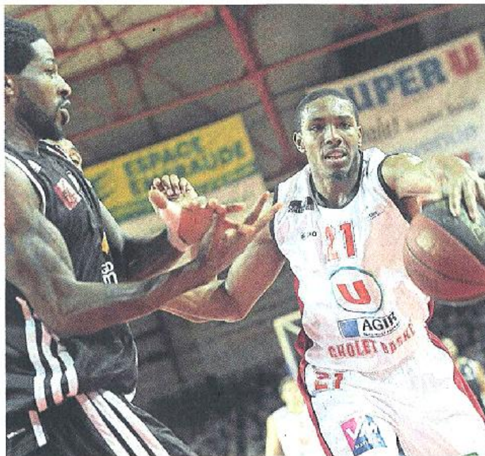
Cholet, la Meillerale, hier. L'équipage de Nelson (à droite) a coulé à pic. Les Choletais sont bel et bien partis pour un championnat galère.

Du rythme, enfin ! CB s'y sent mieux, Causeur monte sérieusement en régime et Dijon courbe l'échine (20-25, 13 e ). Mais ce diable de Moss (16 points en 12 minutes !) est un vrai cauchemar pour CB qui n'arrive pas à recoller (27-31, 16 e ). Pire : les Choletais encaissent un nouvel éclat des mains de l'Américain Harris (27-40, 19 e ). Insuffisants en défense et sans rythme en attaque, leur retard à la pause est logique (31-42, 20 e ).