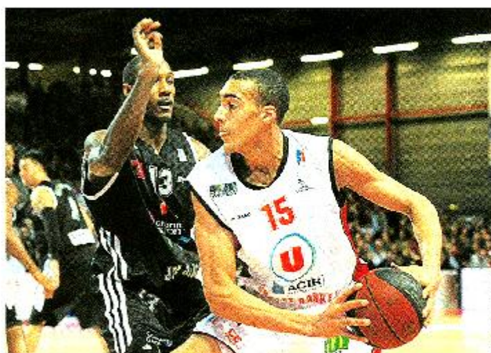
Rudy Gobert et les intérieurs choletais ont également souffert face à leurs homologues dijonnais.