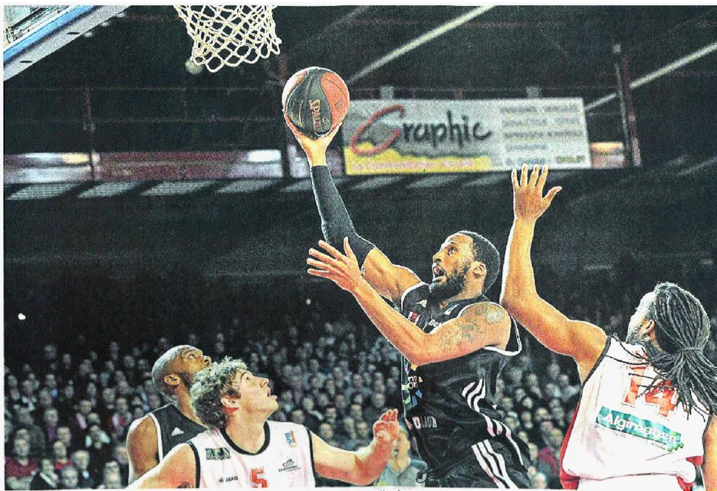
Cholet, la Meilleraie, hier. Le Dijonnais Moss s'est amusé comme un fou dans la raquette. Causeur et Falcker peuvent en témoigner.

Complètement à côté de ses baskets, Cholet s'est fait corriger par la JDA Dijon, hier soir, dans une salle de la Meilleraie frondeuse. Une cinquième défaite consécutive qui dit tout le mal choletais. Inquiétant.