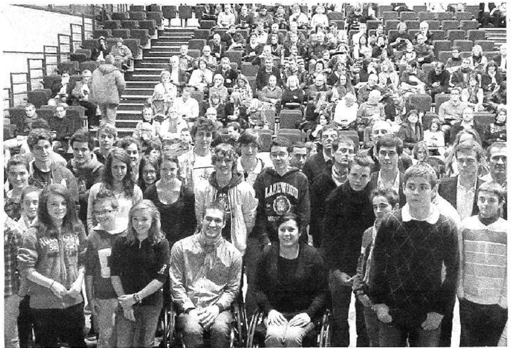
Au premier plan, une partie des sportifs angevins honorés lors de la soirée des champions 2012.

En cette année olympique, le Cdos avait tenu à mettre en avant les sportifs de haut niveau valides mais aussi celles et ceux des sports adaptés, scolaires et du handisport. Une