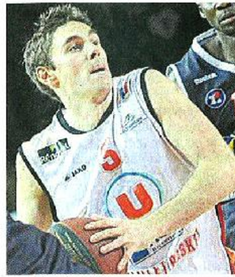
Fabien Causeur, l'homme en forme du moment.

2007 (79-65). A l'époque, un certain Fabien Causeur avait inscrit 11 points pour le Havre. Mais aujourd'hui, l'arrière international a changé de camp et brille avec CB. Avec 21,6 points, 6,3 passes et 2,3 interceptions pour une évaluation moyenne de 23,6 en janvier, il a même été inarrêtable !