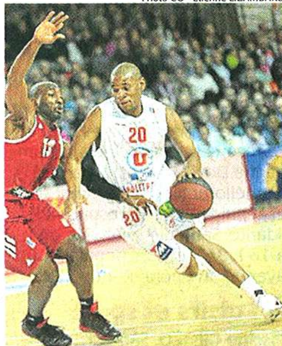
Cholet basket dispute un match à enjeu face à Levallois.

Cholet Basket reçoit Paris-Levallois samedi 12 janvier à 20 heures. Ventes de billets au Smash (en face de la Meilleraie) le samedi 12 janvier de 9 h 30 à 12 heures, dans les magasins Super U de Chemillé, Mauléon, Cholet aux heures d'ouverture du magasin jusqu'à 15 heures le jour du match, par internet, par téléphone au 02 41 58 30 30 ou 02 41 71 65 12 jusqu'à 15 heures le jour du match, aux guichets de la salle à partir de 16 h 45 le jour du match. Tarifs de 4 € à 23 €. Les matches Espoirs ont lieu désormais à 17 heures au lieu de 17 h 15.