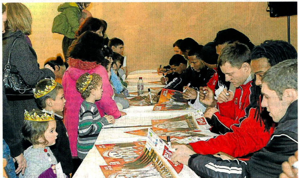
La Meilleraie, hier après-midi. Les champions (l'équipe Pro A) sont venus à la rencontre des joueurs de l'association. Outre la convivialité, la galette est aussi l'occasion de mettre en place la deuxième phase du championnat.

la même occasion, le nombre de licenciés. Tel le principe des vases communicants. A ce propos, cette année, « les pros nous ont acheté des équipements tout neufs, qui étaient avant un peu disparates ». Soit de quoi équiper les joueurs amateurs, du plus petit au plus grand.