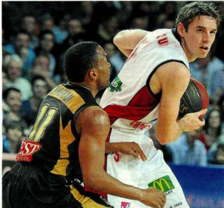
Cholet-Basket, toujours inconstant, devra batailler ferme lors des six dernières journées.