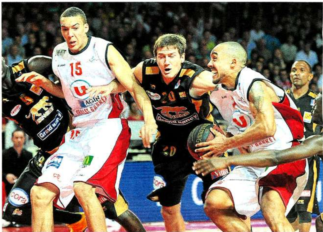
Toute la rage de Luc-Arthur Vebobe n'a pas suffi. Cholet a encore chuté à domicile. Une mauvaise opération dans la course aux playoffs même si tous les concurrents directs ont perdu.

Un alley-hoop spectaculaire de Christopher sonna le réveil maugeois. Le passage en défense de zone et surtout l'option Gradit sur le poste 4 (intérieur)