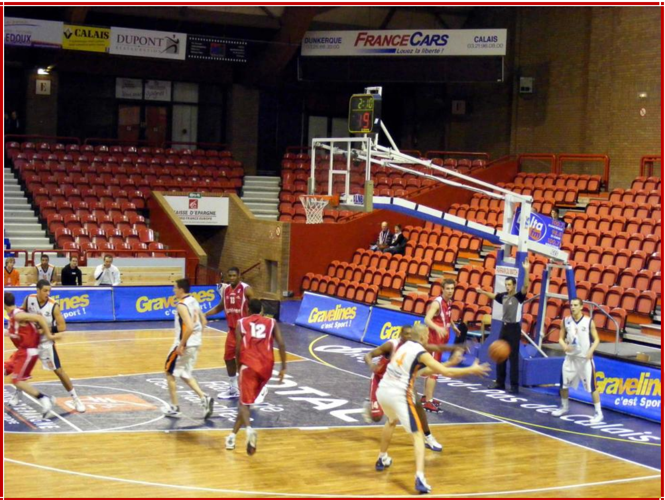
Le match des Espoirs.