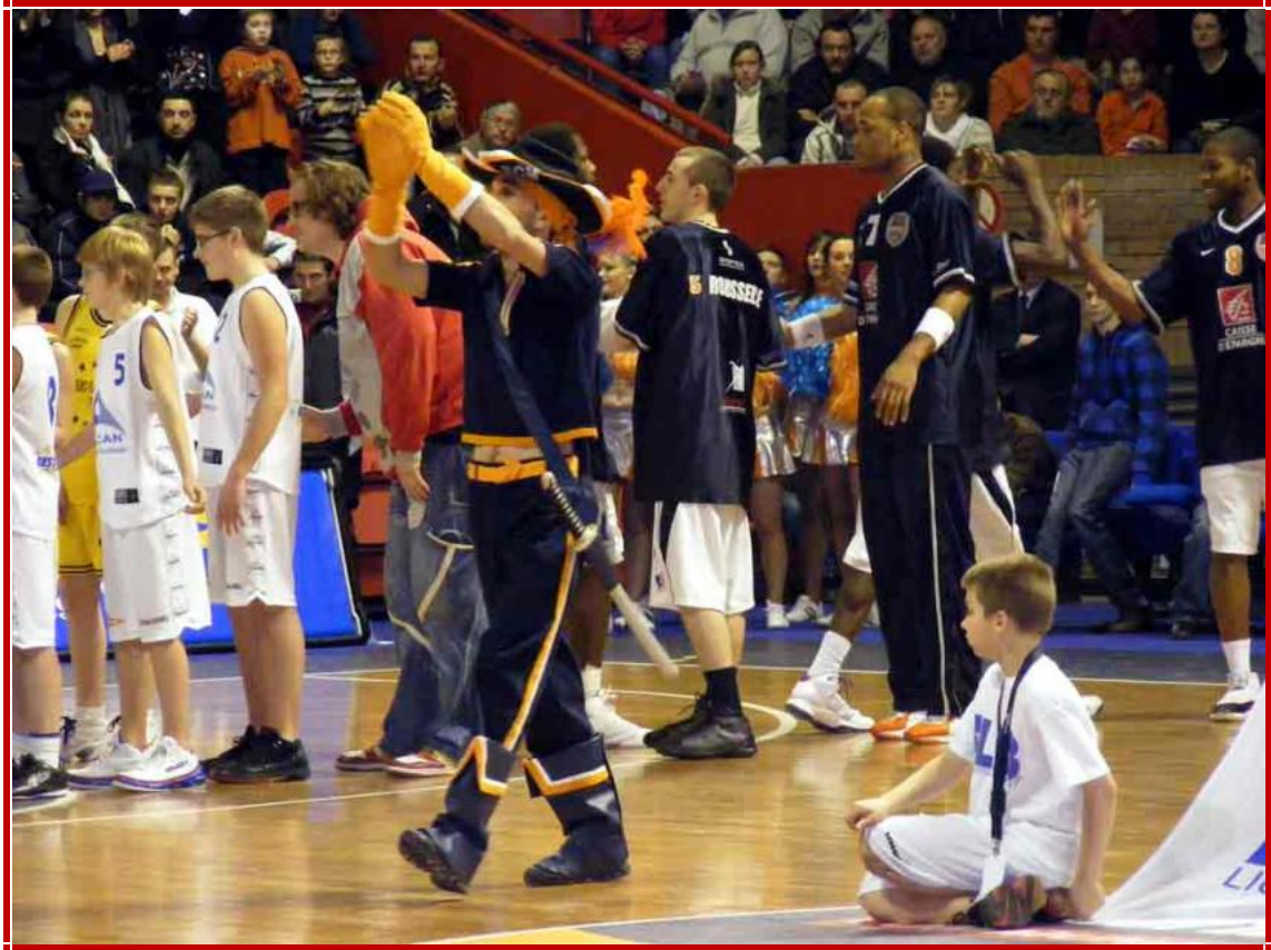
Mascotte et Pom Poms Girls chauffent la salle avant l'entrée des joueurs