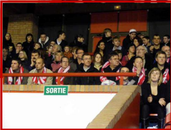
Les invités de l'entreprise BATISTYL assistent au match.