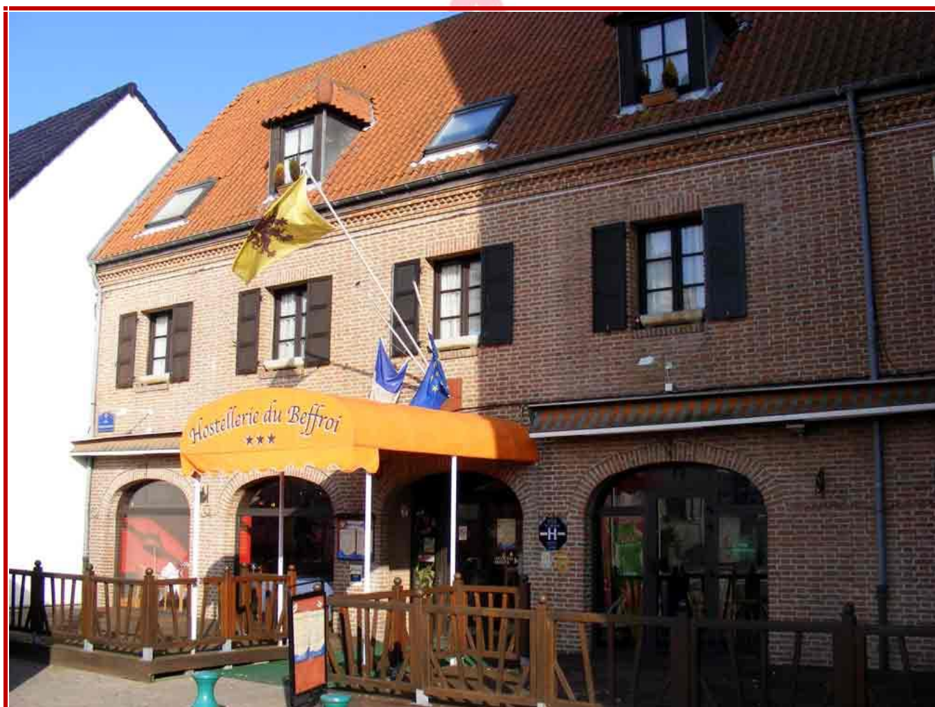
L'hôtel où séjournait l'équipe