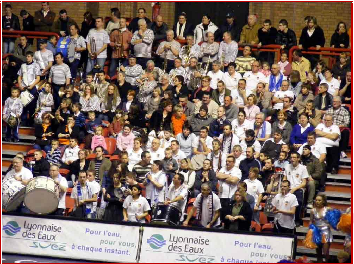
Le public Gravelinois