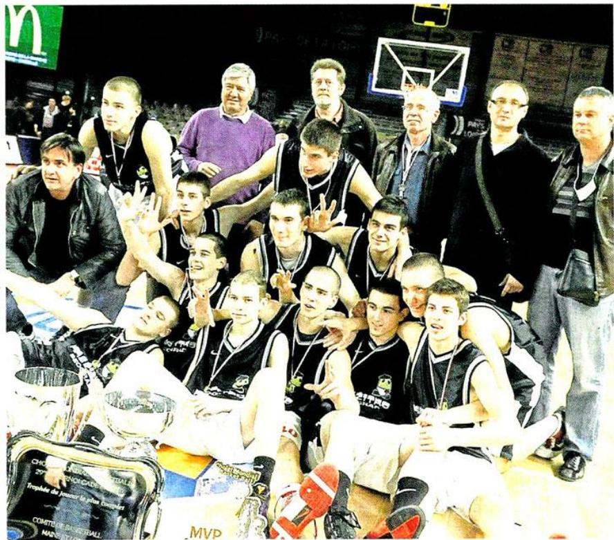
Le KK Zitko version 2011 est-il aussi talentueux que son homologue 2010, vainqueur l'an passé ? Début de réponse aujourd'hui.

Poule Rouge : ESAC San Sebastian (Espagne), BCM Ostrava (Rép. Tchèque), ES Chalon-sur-Saône. Poule Jaune : Reda Basketball (Canada), Stella Azzura Rome (Italie), Cholet Basket. Poule Verte : KK Zitko (Serbie), Joviat La Salle Manresa (Espagne), Orléans Loiret