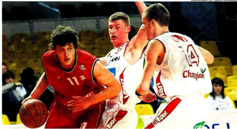
Le Mondial Basket permet de voir à l'œuvre des talents prometteurs.

Les organisateurs ont également prévu toute une série d'animations le long du week-end : un spectacle