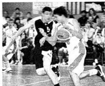
Français et Espagnols ne se sont fait aucun cadeau pour s'octroyer le gain de la finale.

Réparties en huit groupes (quatre chez les hommes, quatre chez les femmes), les équipes se sont rencontrées le samedi pour disputer les matches de poules sur les parquets des salles Delessert et des Hauts Sentiers ainsi que dans la salle des sports de Vivy. À l'issue de ces confrontations, la sélection des Pays de Loire, Ankara, Pritzen du Kosovo et la sélection de Catalogne se sont qualifiées pour les demi-finales