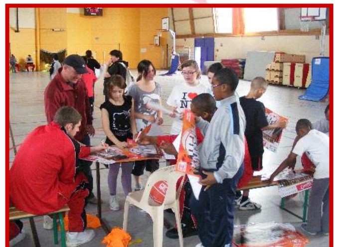
Séance de dédicaces avec les Pro A de Cholet Basket