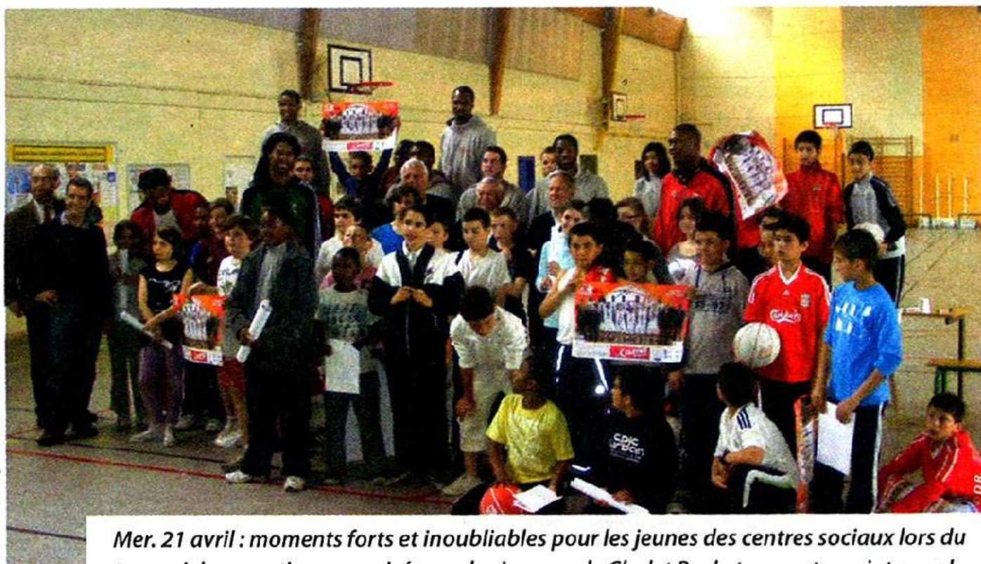
Mer. 21 avril : moments forts et inoubliables pour les jeunes des centres sociaux lors du tournoi des quartiers organisé avec les joueurs de Cholet Basket en partenariat avec la Communauté d'Agglomération du Choletais.