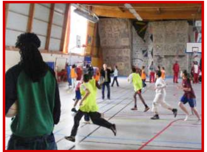
Tournoi coachée par les joueurs de la Pro A de Cholet Basket