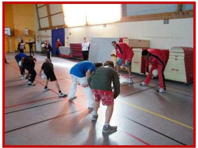
Ateliers avec les Espoirs de Cholet Basket