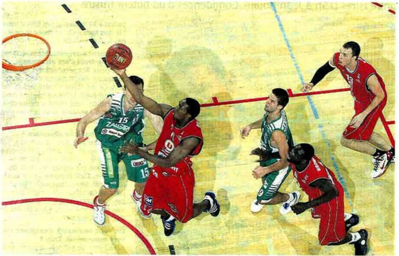
Angers, salle Jean-Bouin, hier. La route qui mène à l'Euroligue sera bien moins dégagée qu'il n'y paraît pour Nelson, Houmounou, Duport et leurs coéquipiers choletais.

Après Vitoria, Cholet Basket a une nouvelle fois chuté face à une formation d'Euroligue. Hier soir, c'est Kaunas qui a montré les limites choletaises.