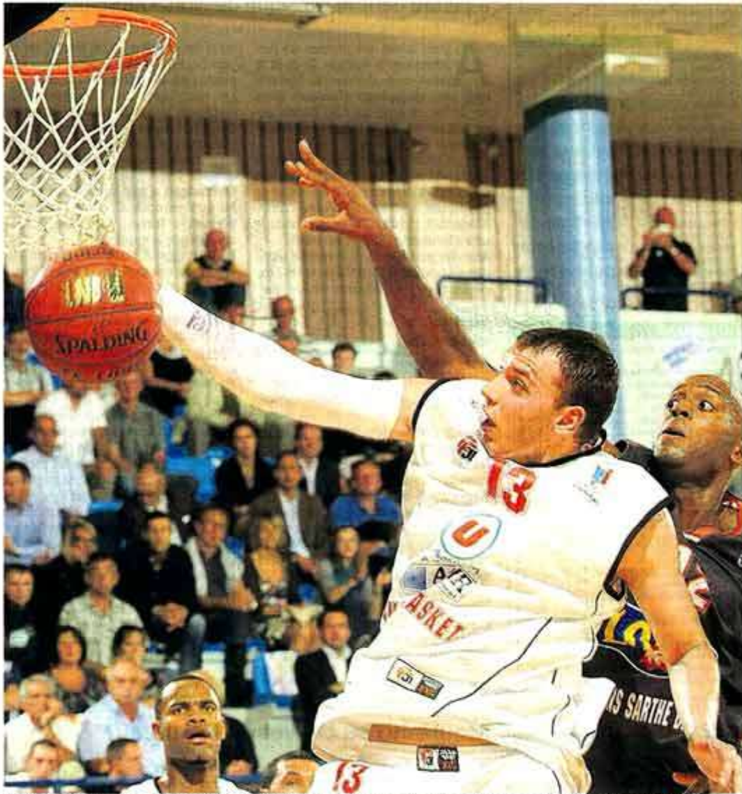
Angers, salle Jean-Bouin, hier. Après des débuts hésitants, Duport est monté en puissance.

Vainqueur hier du Mans, Cholet a démontré que sa défense sera son essence sur la route de la saison.