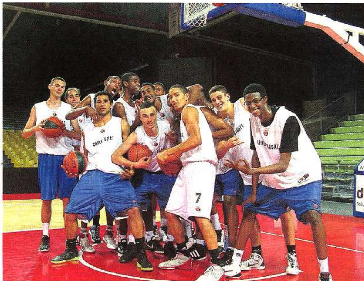
Cholet, mardi 7 juin. Les Espoirs de CB prêts à soutenir leurs aînés à Bercy.