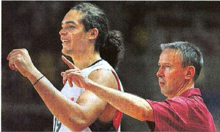
Strasbourg, juillet 2009. Vincent Collet (à droite) mise sur Joakim Noah comme pivot. Ce poste a longtemps été le point faible de la sélection.

Le sélectionneur de l'équipe de France, Vincent Collet, a surpris son monde en révélant hier une sélection de 12 joueurs pour l'Euro, plus quatre remplaçants attitrés.