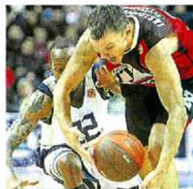
Quatre fois vainqueur de l'Euroleague, Sarunas Jasikevicius a l'expérience des matches-couperet.

Il fut considéré comme l'un des meilleurs joueurs d'Europe entre 2003 et 2005. À l'époque, il avait presque tout gagné. Puis il est parti en NBA. Mais aujourd'hui, le meneur de 34 ans, signé deux semaines après le match aller, n'est plus aussi dominant (4,7 points en Euroleague en 17/