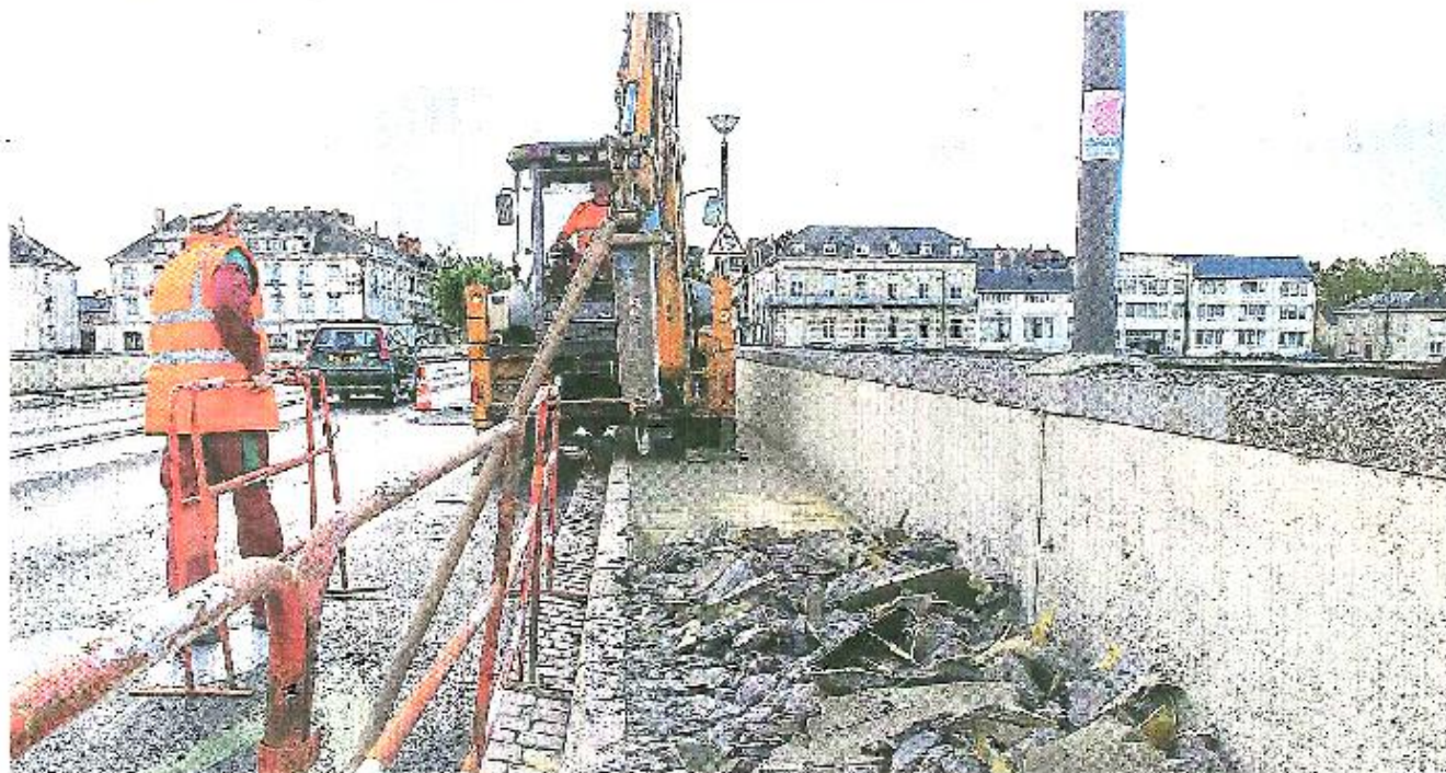
Saumur, pont des Cadets, mardi. Le marteau-piqueur a défoncé le trottoir afin d'accéder aux câbles souterrains enterrés dans le pont.

ERDF mène d'importants travaux de modernisation du réseau électrique haute-tension et souterrain. Sur le pont des Cadets à Saumur, elle remplace actuellement deux câbles de 20 000 volts chacun.