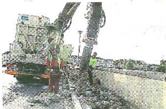
L'aspirateur est piloté à l'aide d'une manette par un technicien.

Seul souci : après le passage de la machine, la tranchée est propre et laisse apparaître les câbles qui sont recouverts de béton. ERDF a conscience qu'ils peuvent représenter une tentation pour les voleurs mais la puissance électrique des câbles (20 000 volts chacun) décourage en général les plus téméraires.