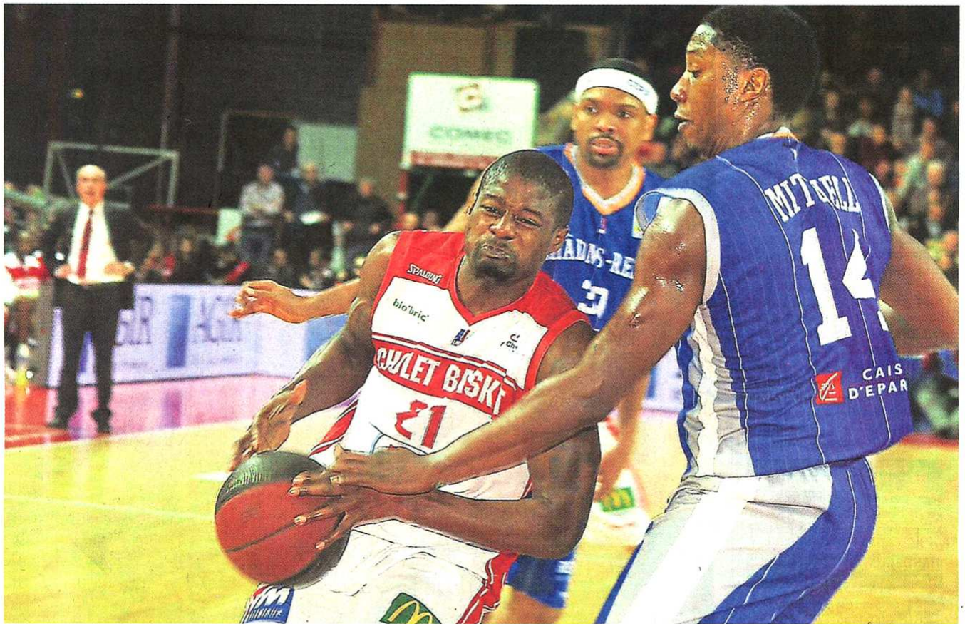
Cholet, La Meillaire, hier soir. Malgré les efforts de Delaney en fin de rencontre, Cholet a été battu par Châlons-Reims.